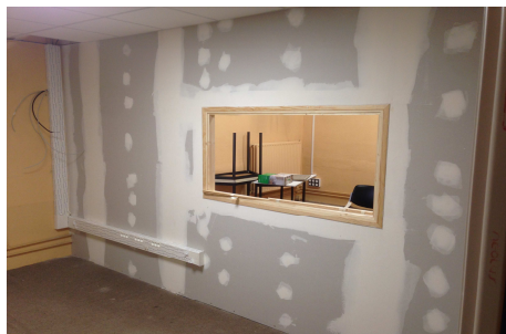
L'aménagement de la cabine technique dans la salle Casteret du centre Saint-Louis

A la rentrée de septembre, Radio Présence Pyrénées vous proposera de nouveaux rendez-vous sur son antenne. Nous aurons l'occasion de vous en reparler. Vous pouvez nous écouter en FM à Saint-Gaudens sur 94.1 et à Bagnères-de-Luchon sur 94. Sinon sur internet : www.radiopresence.com