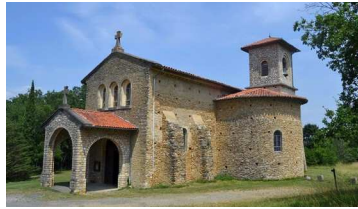
Notre-Dame de Saint-Bernard

9h00 Eglise de Saint-Plancard 10h30 Collégiale de Saint-Gaudens 10h30 Eglise d'Aspet 10h30 Eglise de Montréjeau 10h30 Eglise de Salies du Salat 11h00 Cathédrale de Saint-Bertrand de Cges